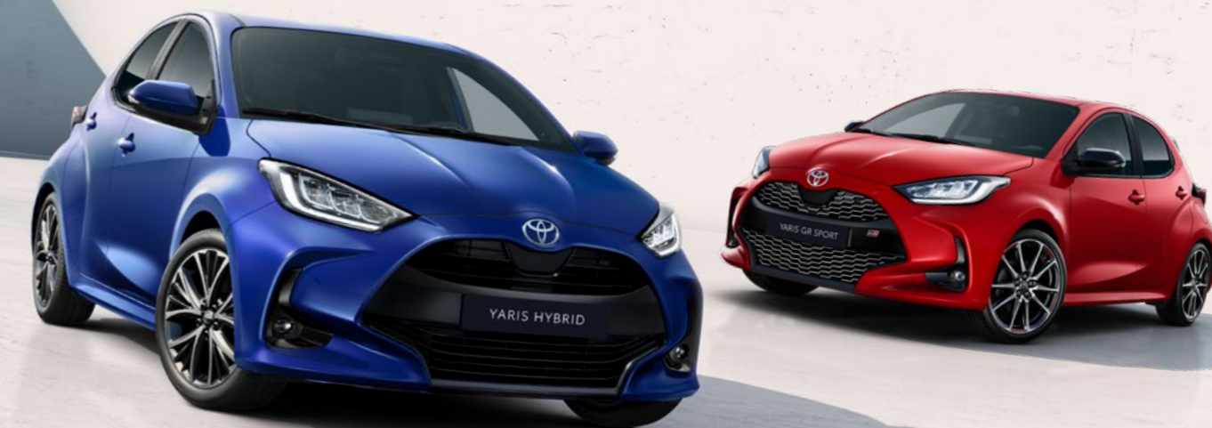
Nabídka jednobarevných provedení Toyota Yaris