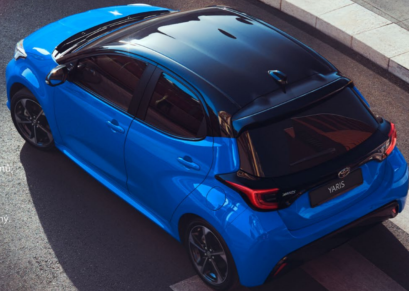
Varianty dvoubarevného lakování Toyota Yaris

Vyberte si z podmanivé nabídky atraktivních odstínů zahrnující výrazné pastelové barvy i zářivé metalické laky. Váš Yaris ve zcela novém odstínu „Modrá Neptune“ nebo dvoubarevném lakování „Modrá Juniper“ bude jednoduše nepřehlédnutelný.