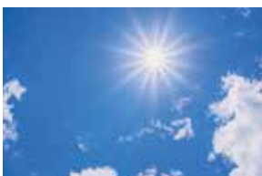
slunečním světlem a UV zářením