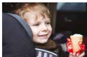
každodenními nečistotami a špínou