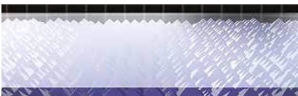
Toyota ProTect vyhlazuje a chrání povrch pomocí keramického povlaku