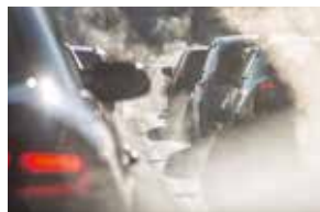
povrchovými nečistotami a výpary