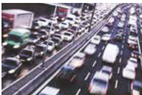
nečistotami na silnici

Toyota ProTect chrání vaše vozidlo před: