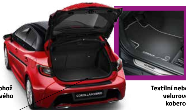
Textilní nebo velurové koberce