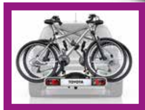
Zadní nosič jízdních kol

Ceny jsou platné po dobu kampaně, obsahují DPH. Produkty nezahrnují náklady na případnou montáž, na kterou se informujte u našeho personálu.