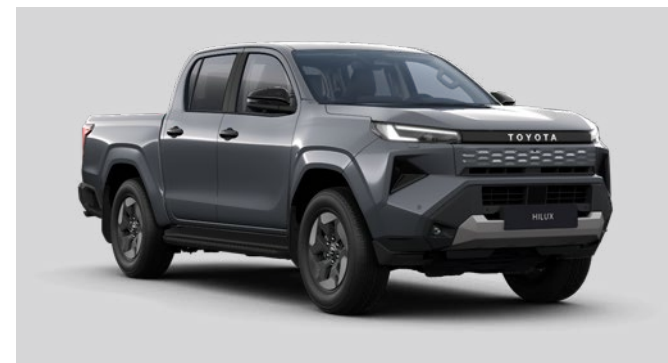
1M2 Šedá – břidlicová metalický lak 17 000 Kč bez DPH