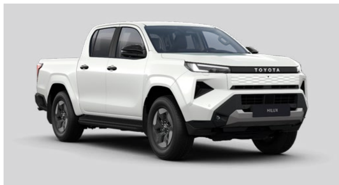
089 Bílá – perleťová perleťový lak 20 500 Kč bez DPH