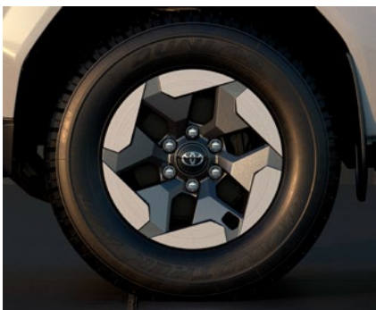
17" kola z lehké slitiny s pneumatikami 265/65 R17