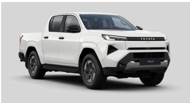
040 Bílá – čistá základní lak bez příplatku