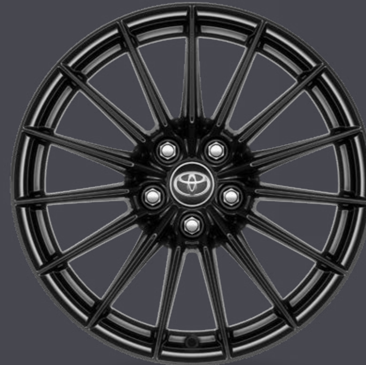
18" litá kola, černá (15 paprsků) Pro výbavu Dynamic