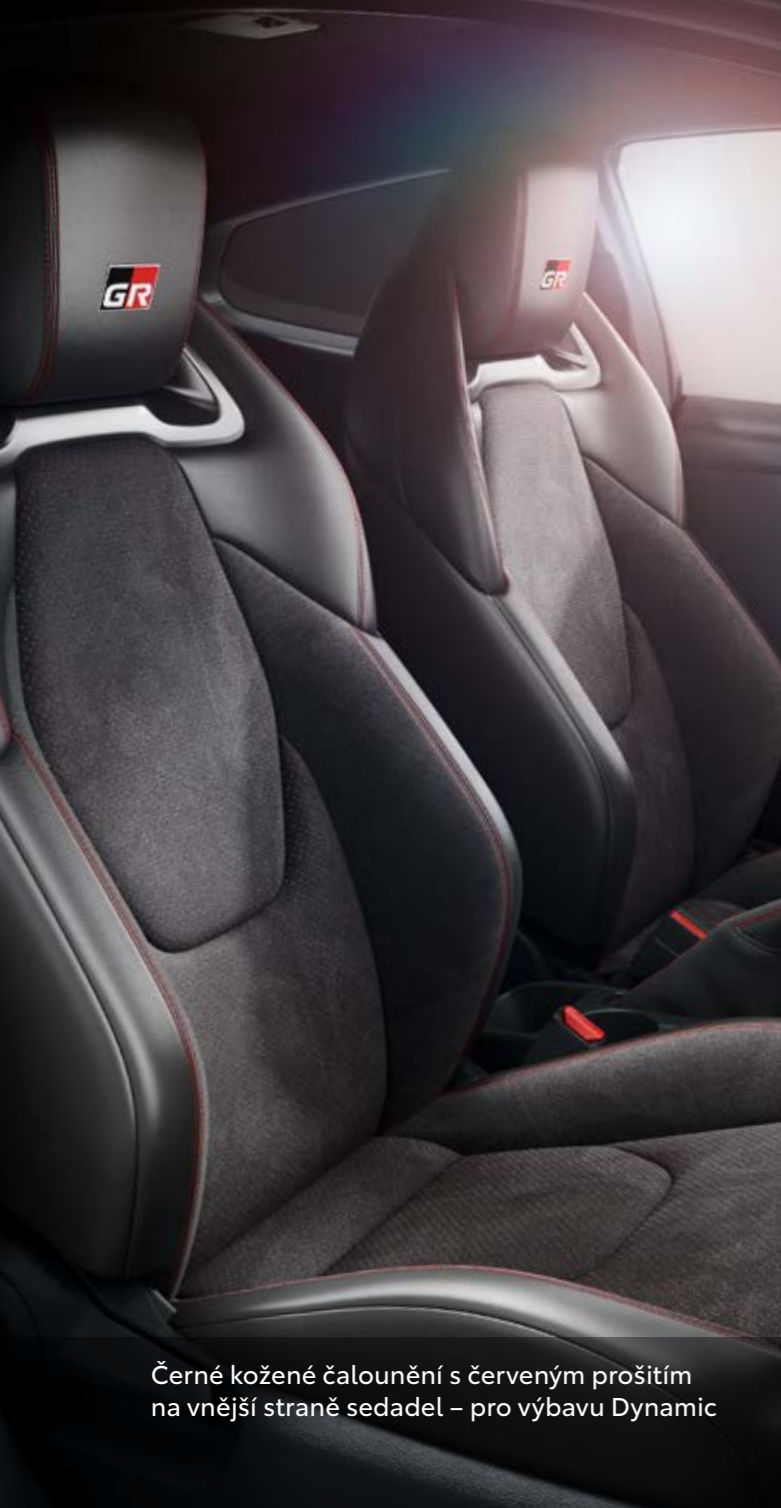
Černé kožené čalounění s červeným prošitím na vnější straně sedadel – pro výbavu Dynamic