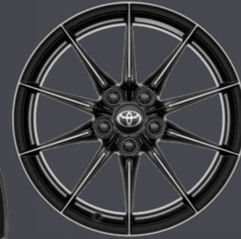
18" kovaná kola z lehké slitiny (10 paprsků) Pro paket Sport