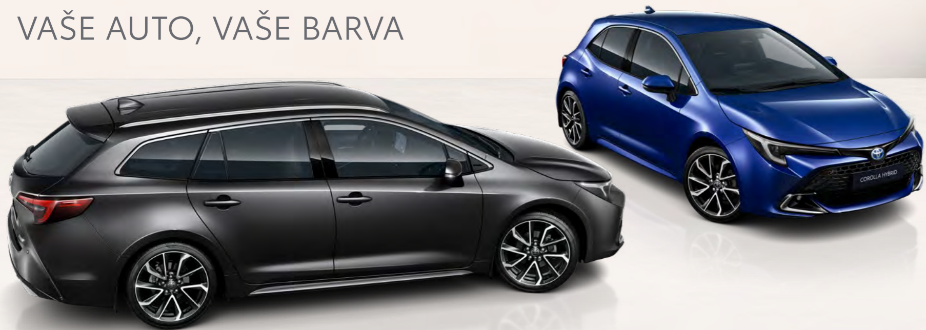
Nabídka odstínů karoserie pro model Toyota Corolla Hatchback a Touring Sports