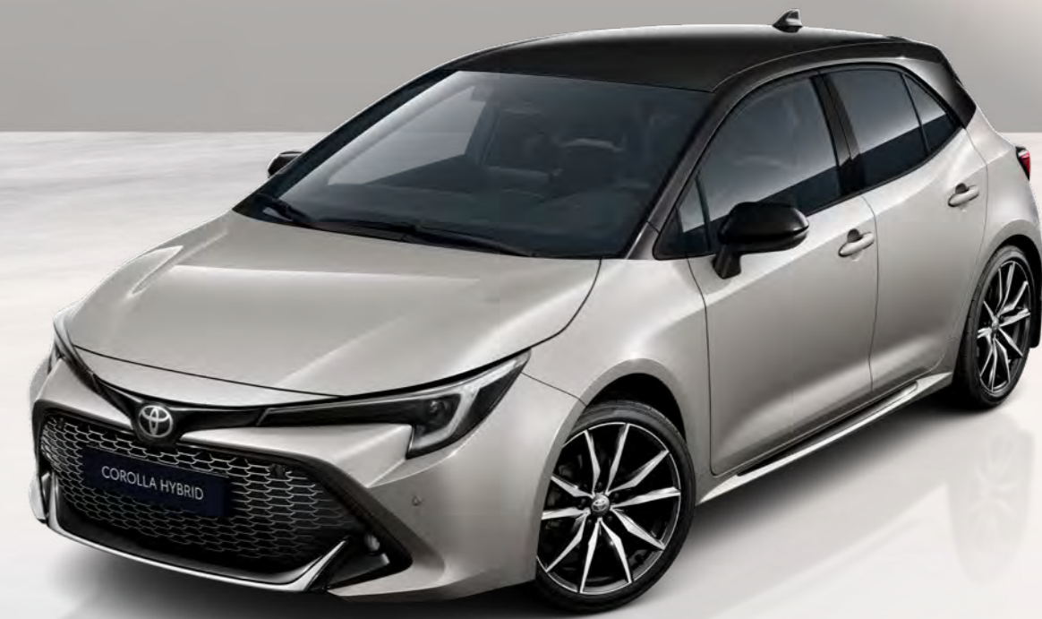
Varianty dvoubarevného lakování pro model Toyota Corolla Hatchback a Touring Sports*