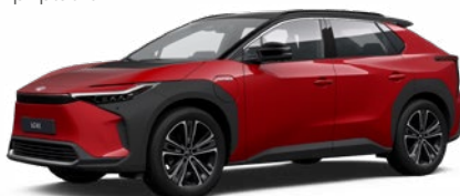
2TB Červená – karmínová se střechou v černé barvě speciální lak, dostupný pro verzi Executive bez příplatku