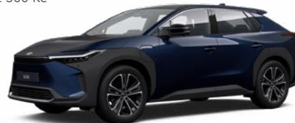
8S6 Modrá – noční metalický lak, dostupný pro verze Comfort a Prestige 15 000 Kč