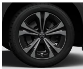
18" kola z lehké slitiny, pneumatiky 235/60 R18 Pro výbavu Comfort a Prestige