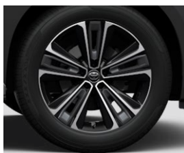
20" lehké slitiny pneumatiky 235/50 R20 Pro výbavu Executive