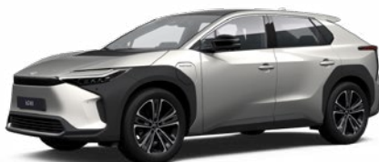
1J6 Stříbrná ušlechtilá speciální lak, dostupný pro verze Comfort a Prestige 22 500 Kč