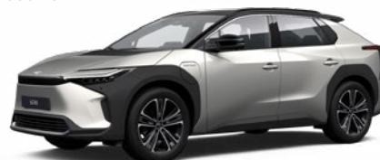
2MR Stříbrná ušlechtilá se střechou v černé barvě speciální lak, dostupný pro verzi Executive bez příplatku