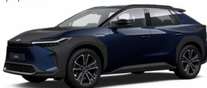
2MT Modrá noční se střechou v černé barvě speciální lak, dostupný pro verzi Executive bez příplatku