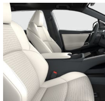
Syntetická kůže světlé Pro výbavu Executive