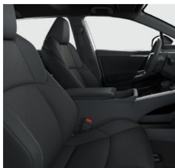
Textilní černé Pro výbavu Comfort