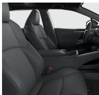
Syntetická kůže černé Pro výbavu Executive