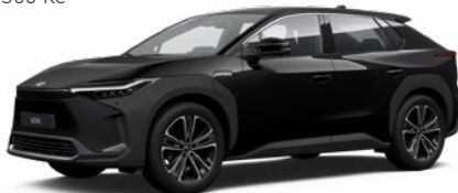
202 Černá hvězdná standardní lak, dostupný pro verze Comfort a Prestige bez příplatku