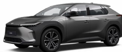
1L5 Stříbrnošedá speciální lak, dostupný pro verze Comfort a Prestige 22 500 Kč