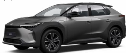
2WC Stříbrnošedá se střechou v černé barvě speciální lak, dostupný pro verzi Executive bez příplatku