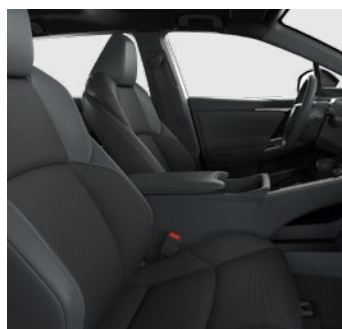
Textilní černé s koženými detaily Pro výbavu Prestige