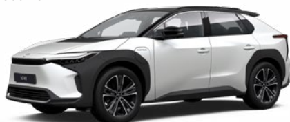
2VP Bílá – perleťová se střechou v černé barvě speciální lak, dostupný pro verzi Executive bez příplatku