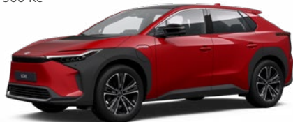
3U5 Červená – karmínová speciální lak, dostupný pro verze Comfort a Prestige 22 500 Kč