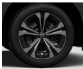
18" kola z lehkých slitin, pneumatiky 235/60 R18 Pro výbavu Comfort a Prestige