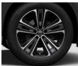
20" litá kola, pneumatiky 235/50 R20 Pro výbavu Executive a Premiere Edition