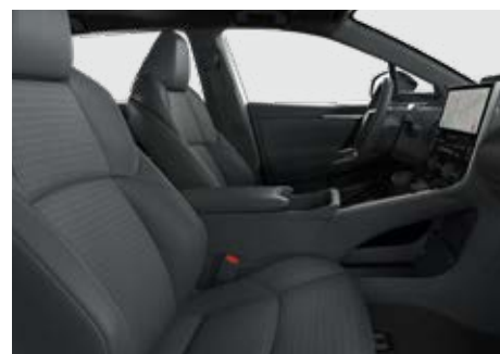
Syntetická kůže černé Pro výbavu Executive a Premier Edition