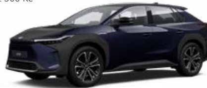
8S6 Modrá – noční metalický lak, dostupný pro verze Comfort, Prestige a Premiere Edition 15 000 Kč