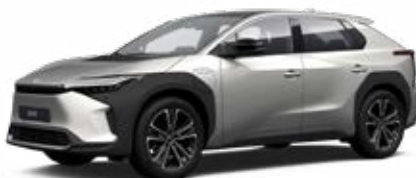
1J6 Stříbrná ušlechtilá speciální lak, dostupný pro verze Comfort, Prestige a Premiere Edition 22 500 Kč