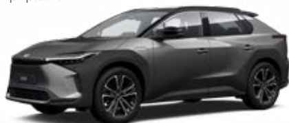
2WC Stříbrnošedá se střechou v černé barvě speciální lak, dostupný pro verzi Executive bez příplatku