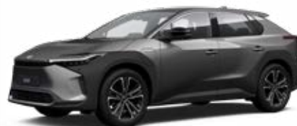
1L5 Stříbrnošedá speciální lak, dostupný pro verze Comfort, Prestige a Premiere Edition 22 500 Kč