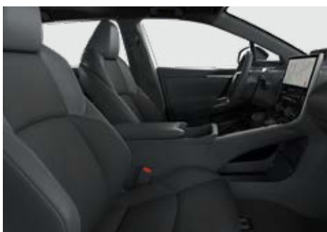
Textilní černé s koženými detaily Pro výbavu Prestige