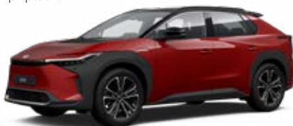
2TB Červená – karmínová se střechou v černé barvě speciální lak, dostupný pro verzi Executive bez příplatku