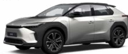
2MR Stříbrná ušlechtilá se střechou v černé barvě speciální lak, dostupný pro verzi Executive bez příplatku