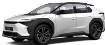
2VP Bílá – perleťová se střechou v černé barvě speciální lak, dostupný pro verzi Executive bez příplatku