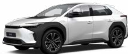
089 Bílá – perleťová perleťový lak, dostupný pro verze Comfort, Prestige a Premiere Edition 22 500 Kč