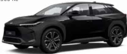
202 Černá hvězdná standardní lak, dostupný pro verze Comfort, Prestige a Premiere Edition bez příplatku