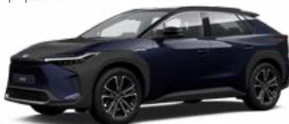
2MT Modrá noční se střechou v černé barvě speciální lak, dostupný pro verzi Executive bez příplatku