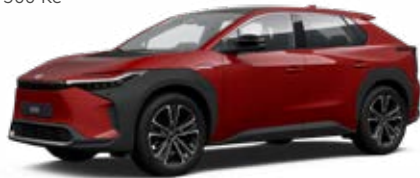
3U5 Červená – karmínová speciální lak, dostupný pro verze Comfort, Prestige a Premiere Edition 22 500 Kč