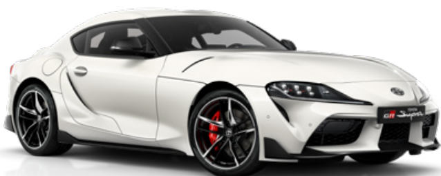
D01 – Bílá metalický lak, 22 500 Kč