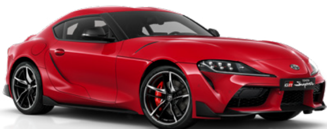
D05 – Červená Prominence standardní lak, bez příplatku