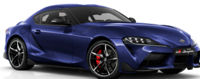
D13 – Modrá metalický lak, 22 500 Kč