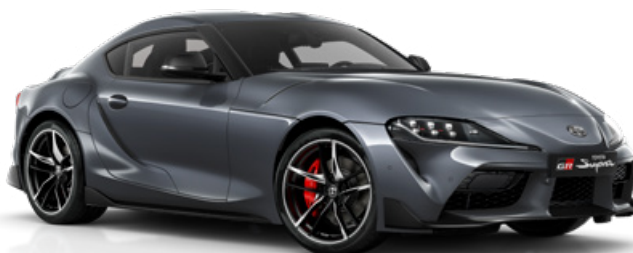
D14 – Šedá metalický lak, 22 500 Kč