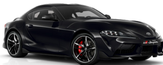
D04 – Černá metalický lak, 22 500 Kč