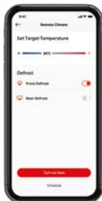
Ovládání nabíjení a klimatizace na dálku