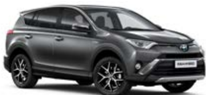
1G3 Šedá – popelavá*