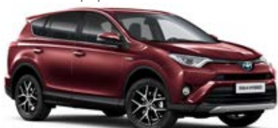
3T0 Červená – granátová*