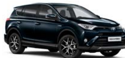
221 Modrá – tmavá hlubinná*