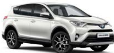
070 Bílá – perleťová**