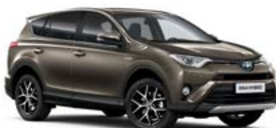
4T3 Běžová – cappuccino*