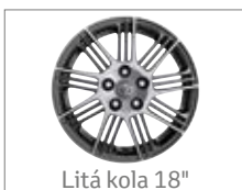
Litá kola 18"