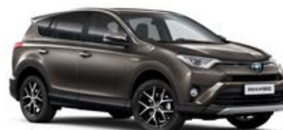
4U5 Hnědá – tmavá*

* Metalický lak karoserie ** Perleťový lak karoserie