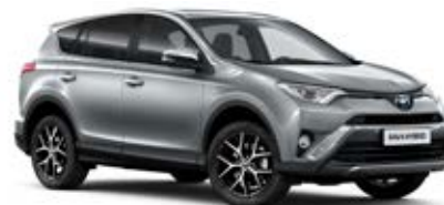
1D6 Stříbrná – zirkonová*