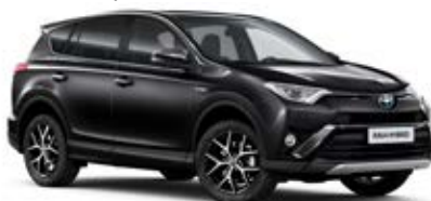
209 Černá – noční obloha*