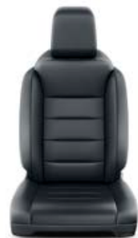
Čalounění sedadel černé kožené Standardně pro verze VIP, volitelná výbava pro verze Family (Paket Leather)