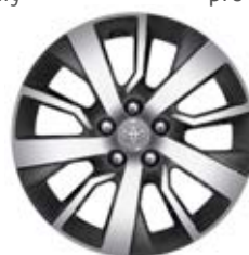
17" Kola z lehkých slitin Standardně pro verze VIP, volitelná výbava pro verze Shuttle a Family