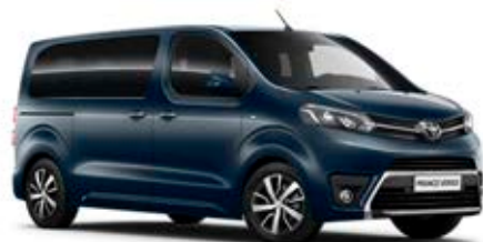
KNP Modrá – Martinik