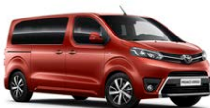
KHK Červená – turmalínová*