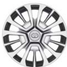
16"/17" Ocelové disky kol Standardně pro verze Shuttle (16") a Family (17")