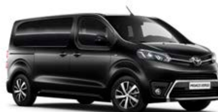
EXY Černá – Sicílie