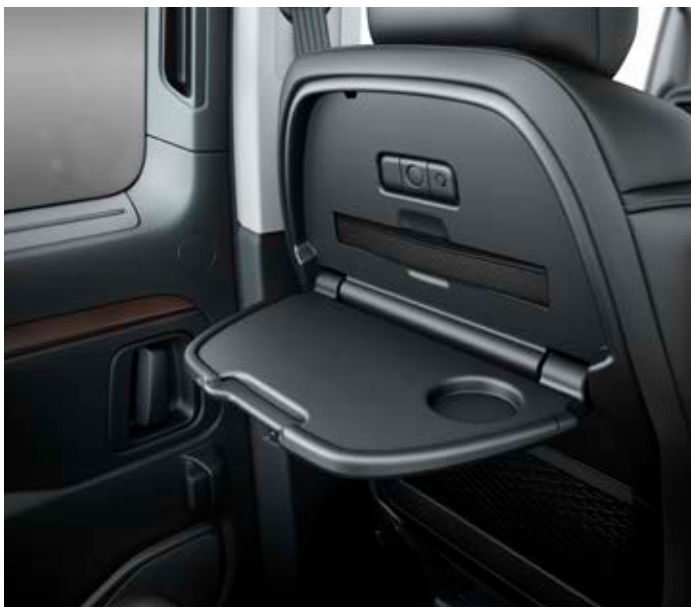
Stolky v opěradlech předních sedadel umožňují cestujícím odložení drobných předmětů.