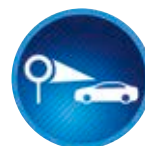
Systém rozpoznávání dopravních značek (RSA)

Asistent pro jízdu v pruzích, jako součást bezpečnostního systému Toyota Safety Sense, sleduje kamerou vodorovné značení vpředu na vozovce, a pokud vozidlo začne vyjíždět z jízdního pruhu, aniž by řidič dal znamení o změně směru jízdy, systém jej akustickým a optickým varováním upozorní – řidič pak může směr jízdy upravit.