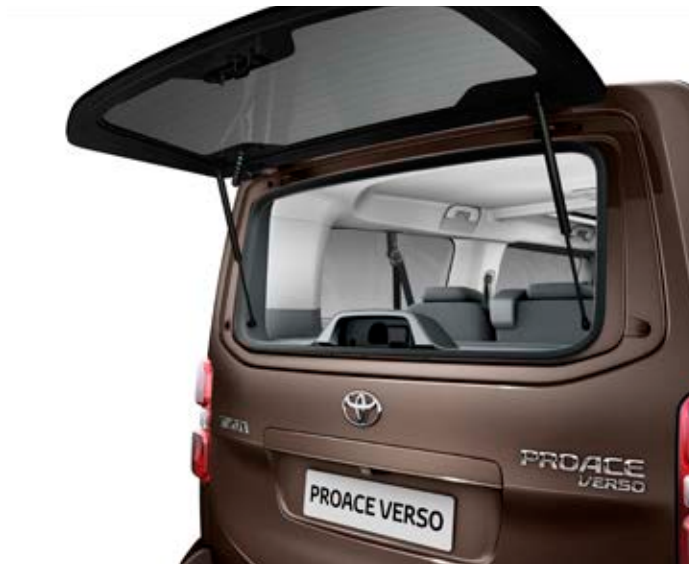
Samostatně otevíratelné okno zadních výklopných dveří (standardně ve verzi Family a VIP, volitelně pro Shuttle) umožňuje přístup do zadní části vozidla bez nutnosti otevírání celého víka zavazadlového prostoru.