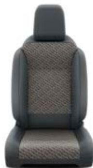
Čalounění sedadel Toyota v kombinaci černé a hnědé barvy – textilie Standardně pro verze Family