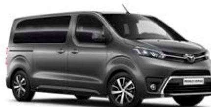
EVL Šedá – tmavá*