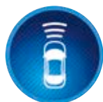
Předkolizní bezpečnostní systém s funkcí rozpoznávání chodců (PCS+PD)

Bezpečnostní systém předcházení kolizím využívá kameru ve spojení s laserem k rozpoznávání vpředu jedoucích vozidel. Pokud systém vyhodnotí potenciální riziko nehody, řidič je akustickým a vizuálním varováním upozorněn a současně se aktivuje brzdový asistent. V případě, že řidič nezačne včas sám brzdit, automaticky se aktivují brzdy s cílem střetu zabránit, nebo alespoň minimalizovat jeho následky.