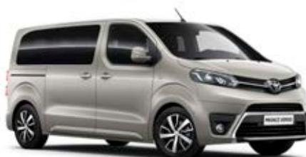
NEU Béžová – sametová*