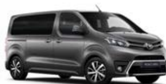
EVL Šedá – tmavá metalický lak 15 000 Kč