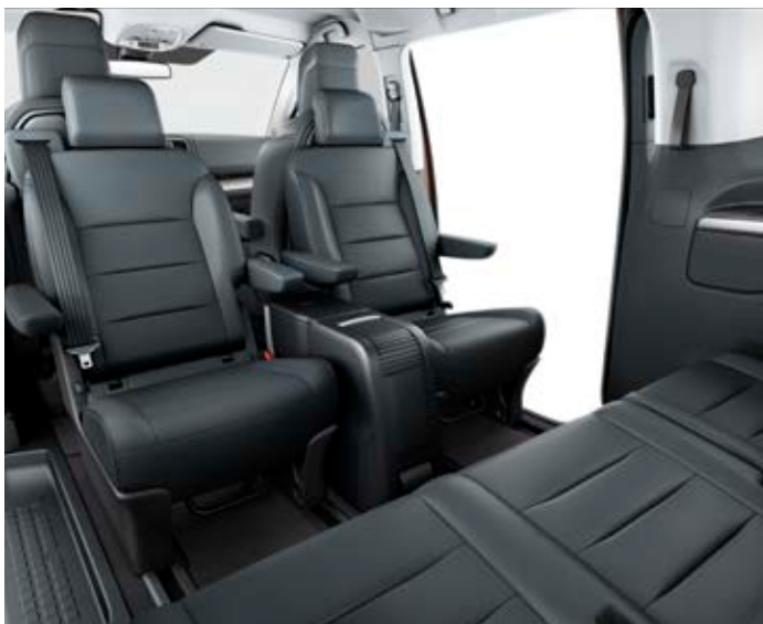
2. řada sedadel ve verzi VIP je vybavena dvojicí komfortních kapitánských sedadel s možností natočení proti směru jízdy (instalace v kolejnicích).