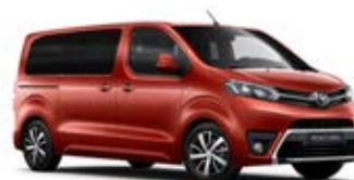
KHK Červená – turmalínová* metalický lak 15 000 Kč