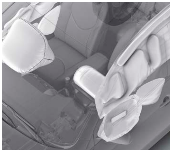
Airbagy pro řidiče a spolujezdce, boční okenní airbagy chránící hlavu a hrudník v 1. řadě sedadel, boční okenní airbagy ve 2. a 3. řadě