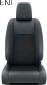
Čalounění sedadel tmavě šedé – textilie Standardně pro verze Shuttle