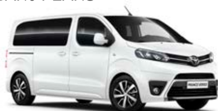
EWP Bílá – arktická