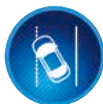
Systém opuštění jízdního pruhu (LDA)

Bezpečnostní systém předcházení kolizím využívá kameru ve spojení s laserem k rozpoznávání vpředu jedoucích vozidel. Pokud systém vyhodnotí potenciální riziko nehody, řidič je akustickým a vizuálním varováním upozorněn a současně se aktivuje brzdový asistent. V případě, že řidič nezačne včas sám brzdit, automaticky se aktivují brzdy s cílem střetu zabránit, nebo alespoň minimalizovat jeho následky.