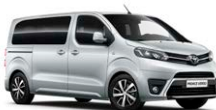
EZR Stříbrná – atomická*