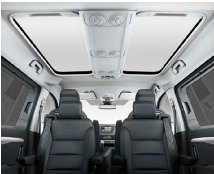
Multifunkční střeška (ve verzi VIP s ambientním LED osvětlením) poskytuje dostatek světla pro všechny cestující ve dne i v noci.