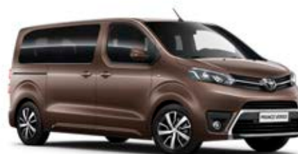
KCM Hnědá – dubová*