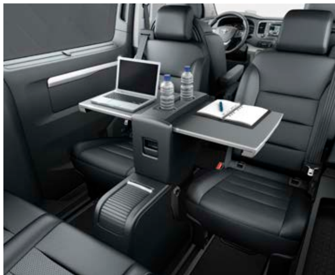
Multifunkční stůl mezi 2. a 3. řadou (k dispozici ve verzi VIP) výrazně zlepšuje pohodlí cestujících na zadních sedadlech.