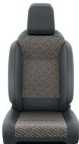
Čalounění sedadel Toyota v kombinaci černé a hnědé barvy – textilie Pro výbavu Family