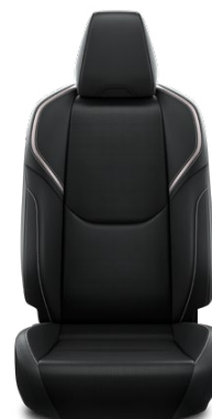
Černé čalounění z veganské kůže (EA20) Pro verzi Executive