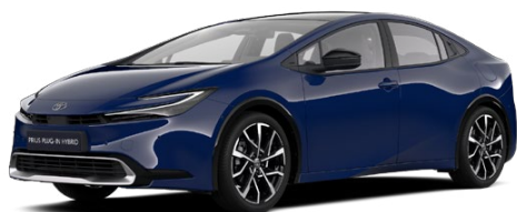
8Q4 Modrá námořní Základní lak bez příplatku