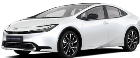
089 Bílá perleťová Perleťový lak 22 500 Kč