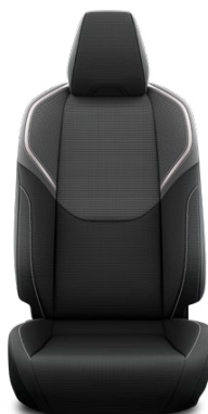
Látkové čalounění (FA20) Pro verzi Comfort a Prestige