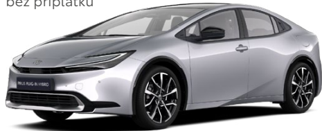
110 Stříbrná třpytivá Metalický lak 15 000 Kč