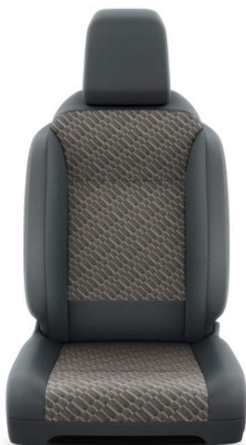
Čalounění sedadel Toyota v kombinaci černé a hnědé barvy – textilie Pro výbavu Family