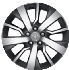
17" litá kola Pro výbavu Comfort