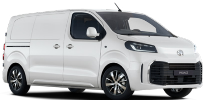
EPR Bílá – ledová