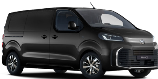
KTV Černá – Sicílie 2