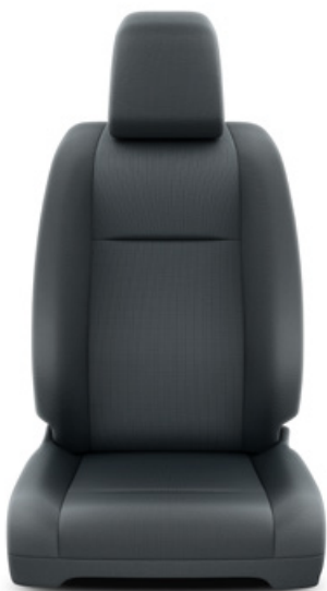
Textilní šedé Pro výbavu Active, Comfort a CrewCab