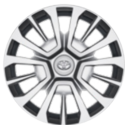
16" ocelová kola s celoplošnými kryty Pro výbavu Active a CrewCab