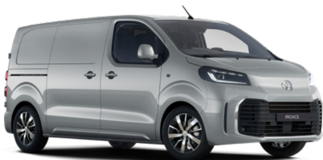
KCA Stříbrná – atomická 2