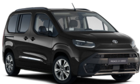
KTV Černá vesmírná metalický lak 15000 Kč