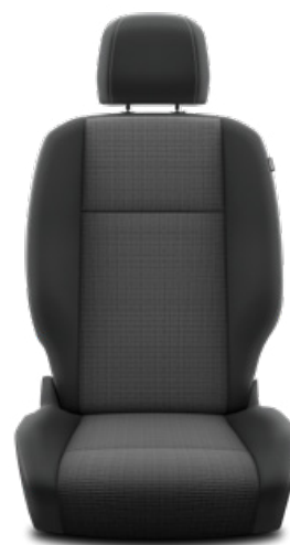
Látkové čalounění sedadel Manhattan Pro výbavu Business, Family a VIP