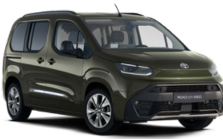
KNQ Zelená khaki metalický lak 15000 Kč