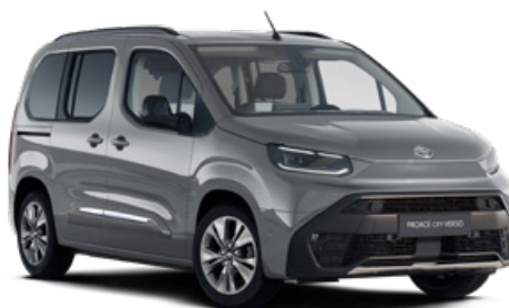
KCA Stříbrná atomická metalický lak 15000 Kč