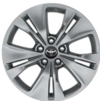
17" litá kola (5 zdvojených paprsků) Pro výbavu Family