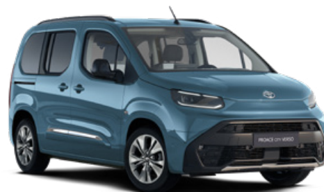
KJW Světlá modrá metalický lak 15000 Kč