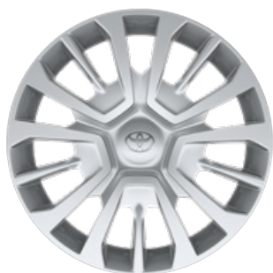
16" ocelové disky kol s ozdobnými kryty (5 trojitých paprsků) Pro výbavu Business