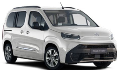
EPR Bílá ledová standardní lak bez příplatku