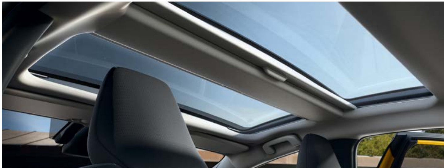
– Panoramatická střeška s manuálně ovládanou roletou