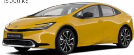
5C5 Žlutá hořčicová Metalický lak 15 000 Kč