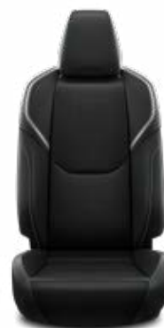
Černé čalounění z veganské kůže (EA20) Pro verzi Executive