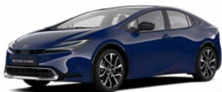
8Q4 Modrá námořní Základní lak bez příplatku