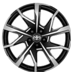
19" kola z lehkých slitin, pneumatiky 195/50 R19 Pro verzi Prestige a Executive