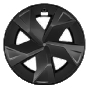
17" kola z lehkých slitin, pneumatiky 195/60 R17 s celoplošnými kryty Pro verzi Comfort