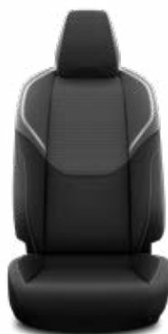
Látkové čalounění (FA20) Pro verzi Comfort a Prestige