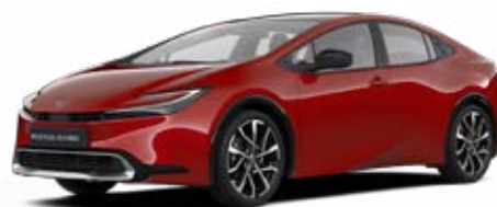
3U5 Červená karmínová Speciální lak 22 500 Kč