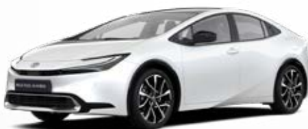
089 Bílá perleťová Perleťový lak 22 500 Kč