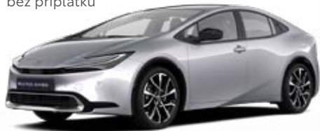
110 Stříbrná třpytivá Metalický lak 15 000 Kč