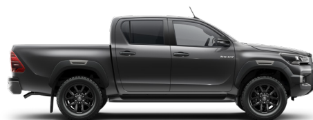
1G3 Šedá – popelavá*