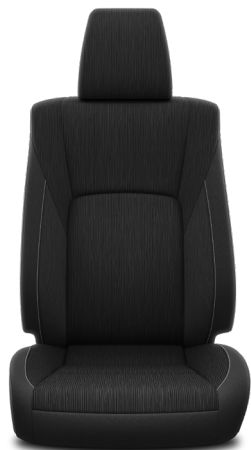
Černá látka Standardně pro výbavu Active a Executive