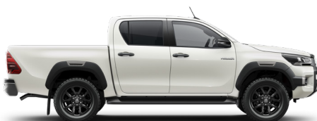
089 Bílá – perleťová