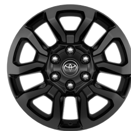
18" litá kola černá broušená (6 paprsků) Standardně pro Invincible