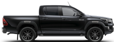
218 Černá – klasická*