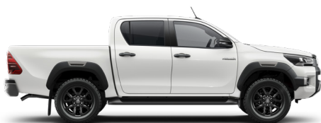
040 Bílá – čistá