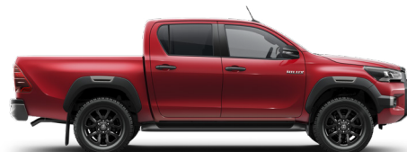
3T6 Červená – vulkanická*