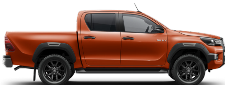
4R8 Oranžová – lávová* 1