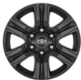
17" litá kola (6 paprsků) Standardně pro Double Cab s výbavou Active