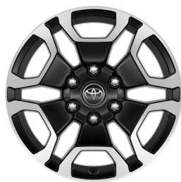
18" litá kola dvoubarevná šedá broušená (6 dvojitých paprsků) Standardně pro Double Cab s výbavou Executive