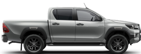
1D6 Stříbrná – zirkonová*