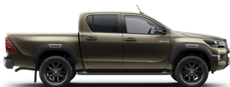
6X1 – Bronzovozelená – Jungle* 1