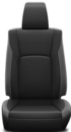
Černá přírodní / syntetická kůže Standardně pro výbavu Invincible