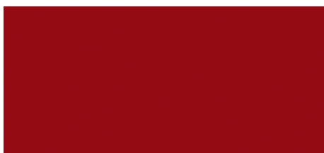
3U5 Červená – karmínová speciální lak, 17 000 Kč