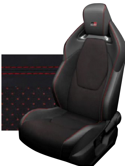
Sedadla černá EKO semiš Ultrasuede™ s červenými akcenty a bočnicemi ze syntetické kůže s lemem v červené barvě EA30 Standardně pro verze Dynamic a Dynamic s VIP paketem