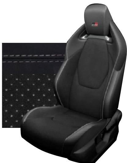
Sedadla černá EKO semiš Ultrasuede™ s šedými akcenty a bočnicemi ze syntetické kůže s lemem v šedé barvě EA20 Standardně pro verze Dynamic a Dynamic s VIP paketem