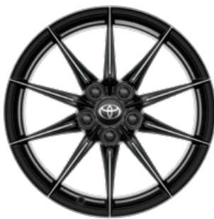
18" kovaná kola, pneumatiky 225/40 R18 Standardně pro verzi Dynamic s paketem VIP