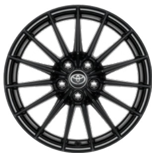
18" kola z lehkých slitin, pneumatiky 225/40 R18 Standardně pro verzi Dynamic