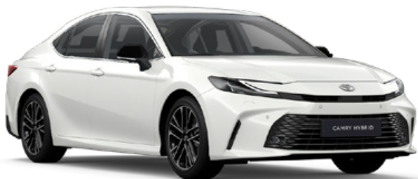
040 Bílá – čistá standardní lak bez příplatku