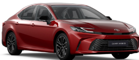
3U9 Červená – karmínová speciální lak 25 000 Kč

Barva karoserie může záviset na verzi výbavy