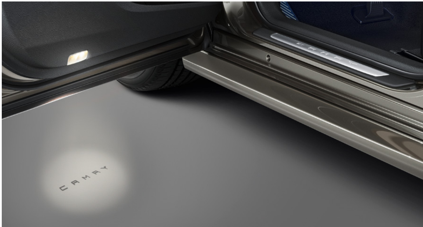
Uvítací osvětlení ve dveřích, osvětlené prahové lišty

k dispozici pro všechny verze (cena s DPH včetně instalace)