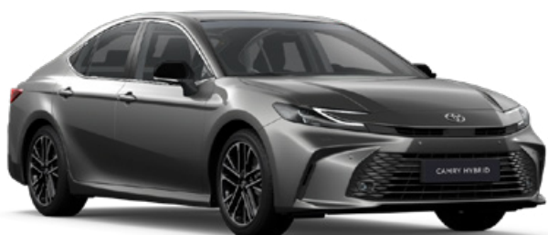
1L5 Stříbrnošedá speciální lak 25 000 Kč