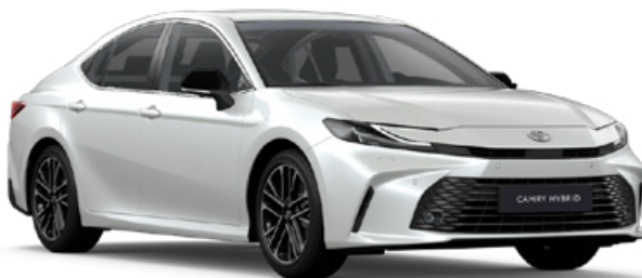
089 Bílá – perleťová perleťový lak 25 000 Kč