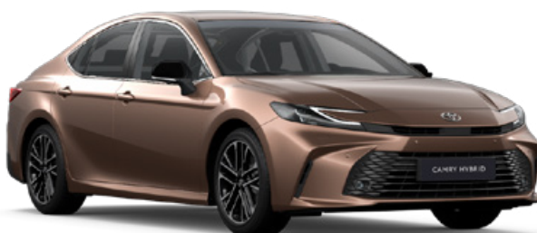
4Y6 Bronzová speciální lak 25 000 Kč