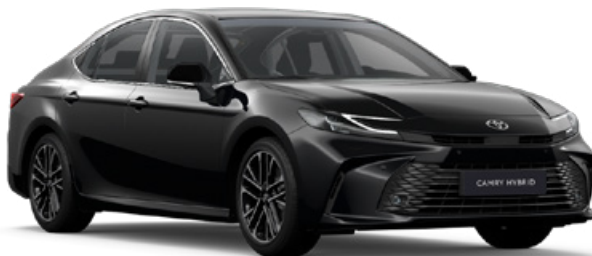
218 Černá – klasická metalický lak 20 000 Kč