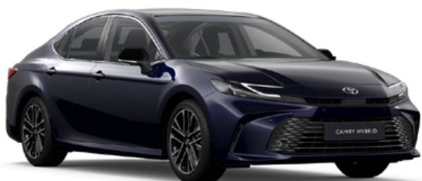
8X8 Modrá – tmná metalický lak 20 000 Kč