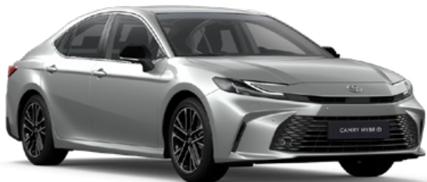
1F7 Stříbrná – saténová metalický lak 20 000 Kč