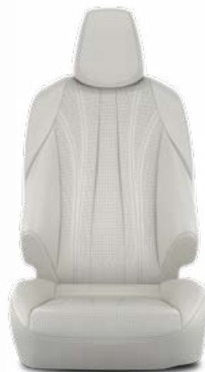
LA01 Přírodní kůže světlé Pro paket VIP