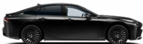
219 Černá – klasická speciální lak 22 500 Kč