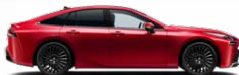
3U5 Červená – karmínová speciální lak 22 500 Kč