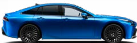
8Y7 Modrá – zářivá speciální lak 22 500 Kč