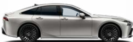
1J6 Stříbrná ušlechtilá speciální lak 22 500 Kč