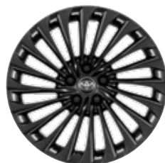
20" kola z lehkých slitin, pneumatiky 245/45 Pro paket VIP