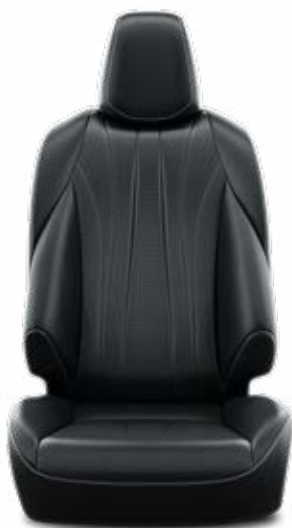
LA20 Přírodní kůže černé Pro paket VIP