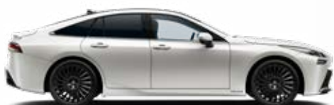
090 Bílá perleťová speciální lak 22 500 Kč