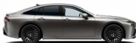
1L5 Stříbrnošedá speciální lak 22 500 Kč