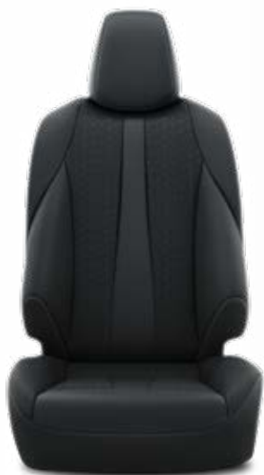
FA20 Textilní černé Pro výbavu Comfort