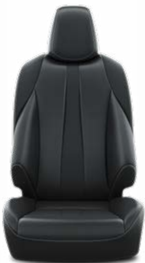
EA20 Syntetická kůže Pro výbavu Executive