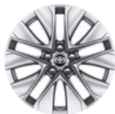
19" kola z lehkých slitin, pneumatiky 235/55 Pro výbavu Comfort