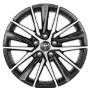
18" kola z lehké slitiny, pneumatiky 235/45 R18 Pro výbavu Prestige a Executive