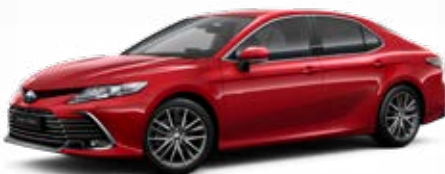
3U9 Červená – karmínová speciální lak 22 500 Kč