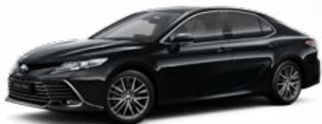
218 Černá – klasická metalický lak 15 000 Kč