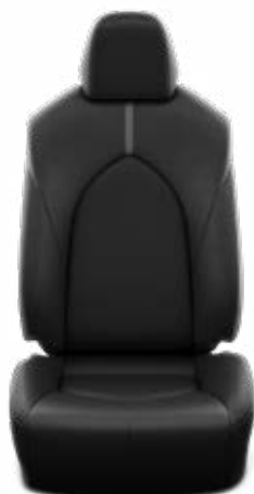
FA20 Textilní černé Pro výbavu Comfort