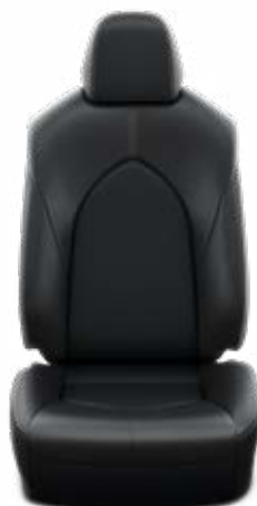
LA20 Černé kozené čalounění přírodní a syntetická kůže s perforací Pro výbavu Executive, paket Business