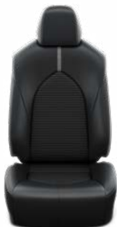
EA20 Kozené čalounění syntetická kůže a textilie – černé Pro výbavu Prestige