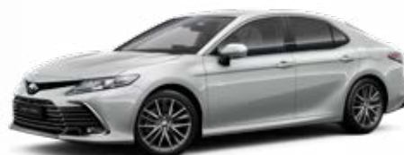
1F7 Stříbrná – saténová metalický lak 15 000 Kč