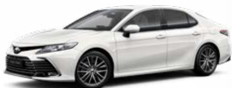
040 Bílá – čistá standardní lak bez příplatku