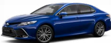
8W7 Modrá – tmavá metalický lak 15 000 Kč