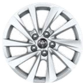
17" kola z lehké slitiny, pneumatiky 215/55 R17 Pro výbavu Comfort