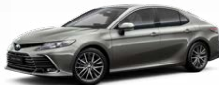
1L5 Stříbrnošedá speciální lak 22 500 Kč