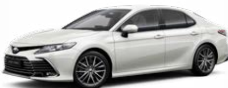
089 Bílá – perleťová perleťový lak 22 500 Kč