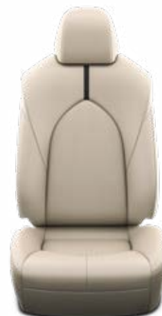
LA40 Běžové kozené čalounění přírodní a syntetická kůže s perforací Pro výbavu Executive, paket Business