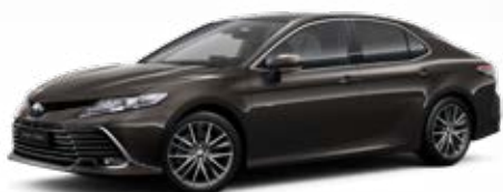
4X7 Hnědá – grafitová metalický lak 15 000 Kč