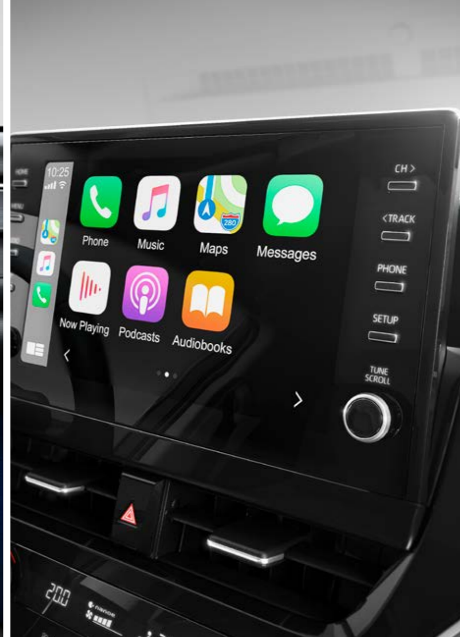
SYSTÉM TOYOTA TOUCH® 2 Dotyková obrazovka o velikosti 9" odhaluje celou plejádu nových funkcí včetně lepší navigace a online aktualizací v reálném čase.