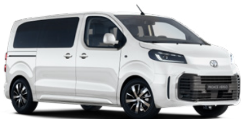
EPR Bílá ledová standardní lak bez příplatku