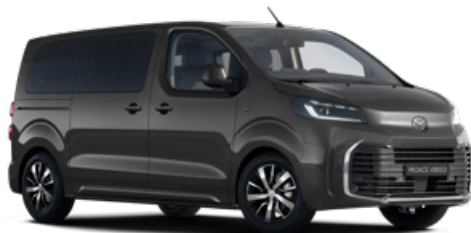
KKJ Šedá titanová metalický lak 15 000 Kč