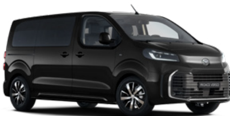
KTV Černá Sicílie metalický lak 15 000 Kč