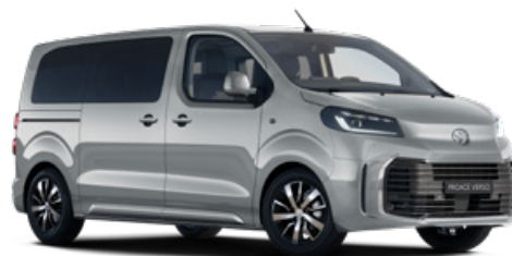
KCA Stříbrná atomická metalický lak 15 000 Kč