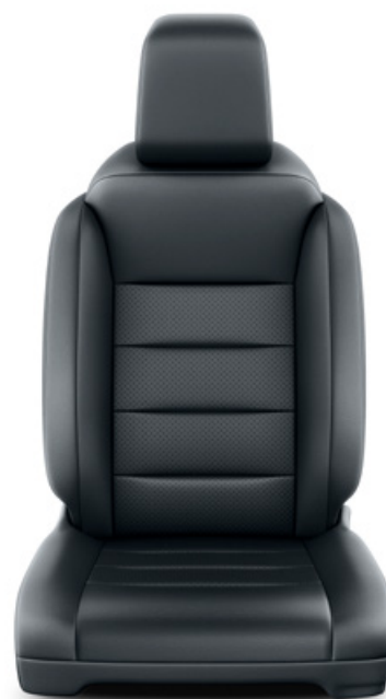
Čalounění sedadel černé kožené Pro výbavu VIP, paket Executive