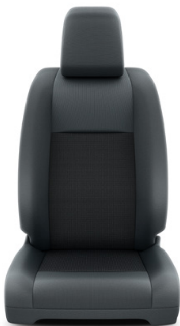
Čalounění sedadel tmavě šedé – textilie Pro výbavu Kombi a Business