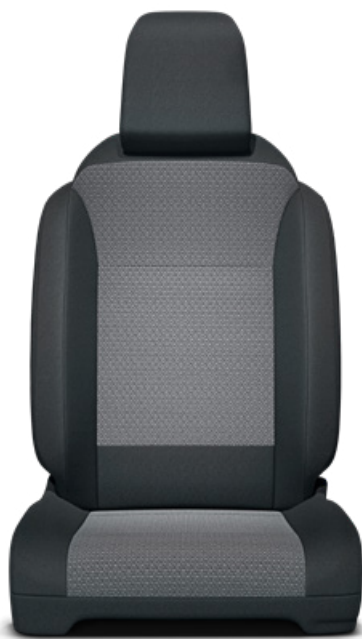
Čalounění sedadel Toyota v kombinaci černé a šedé barvy – textilie Pro výbavu Family