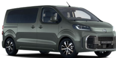
EDU Zelená terénní metalický lak 15 000 Kč