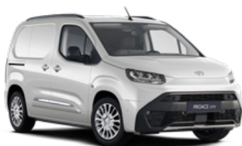
EPR Bílá – ledová standardní lak bez příplatku