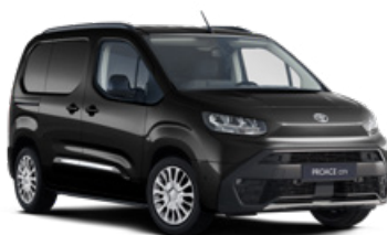
KTV – Černá Vesmírná metalický lak 12 400 Kč