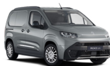
KCA Stříbrná atomická metalický lak 12 400 Kč