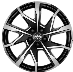
19" kola z lehké slitiny, pneumatiky 195/50 R19 Pro verzi Prestige a Executive