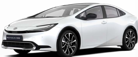
089 Bílá perleťová Perleťový lak 22 500 Kč