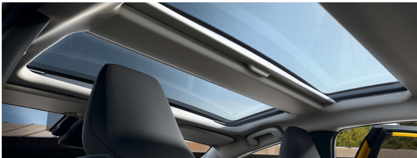
– Panoramatická střecha s manuálně ovládanou roletou