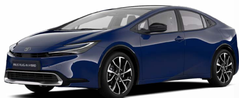
8Q4 Modrá námořní Základní lak bez příplatku