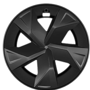
17" kola z lehké slitiny, pneumatiky 195/60 R17 s celoplošnými kryty Pro verzi Comfort