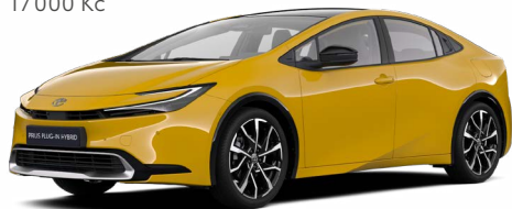
5C5 Žlutá hořčicová Metalický lak 17 000 Kč