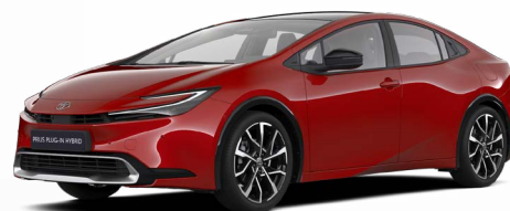
3U5 Červená karmínová Speciální lak 22 500 Kč