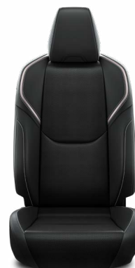
Černé čalounění z veganské kůže (EA20) Pro verzi Executive