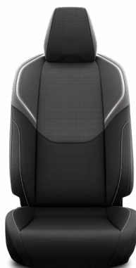
Látkové čalounění (FA20) Pro verzi Comfort a Prestige