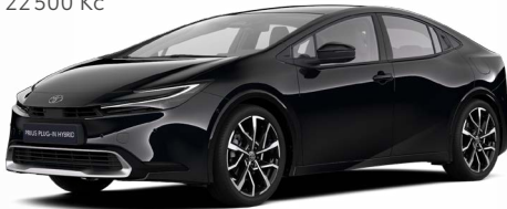
218 Černá klasická Metalický lak 17 000 Kč