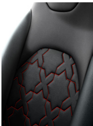
Látkové čalounění černé s prošíváním Chilli/Ginger/Juniper/Urban/Modrošedé dle laku karoserie a černými koženými bočnicemi Pro výbavu Executive