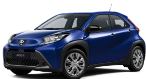
8Y8 Modrá – juniper Metalický lak pro verzi Comfort 10000 Kč