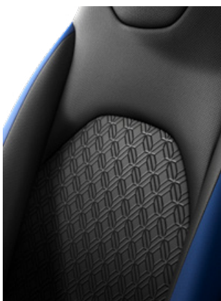
Látkové čalounění černé s bočnicemi v barvě Chilli/Ginger/Juniper/Urban/Modrošedé dle laku karoserie Pro výbavu Style