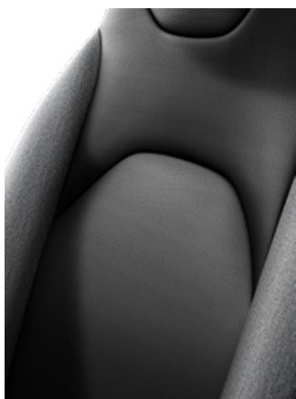
Látkové čalounění černé s šedými bočnicemi Pro výbavu Comfort