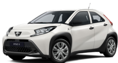
040 Bílá – čistá Základní lak pro verzi Comfort bez příplatku