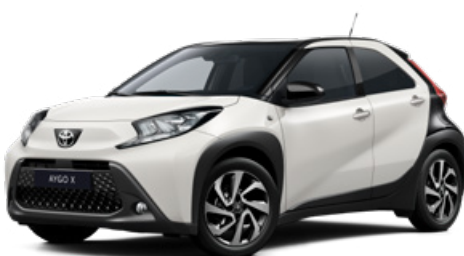
2NR Bílá – čistá s černou střechou Základní a metalický lak pro verzi Style 15000 Kč