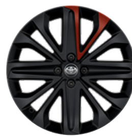
18" kola z lehké slitiny, pneumatiky 175/60 R18 Pro výbavu Style v kombinaci s Design paketem a barvou karoserie 2VH Červená – chilli s černou střechou a 2VL Modrá – juniper s černou střechou.