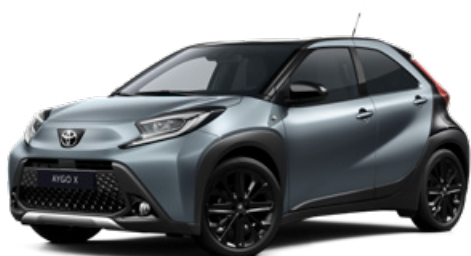
2UP Modrošedá s černou střechou Metalický lak pro verze Style a Executive 15000 Kč