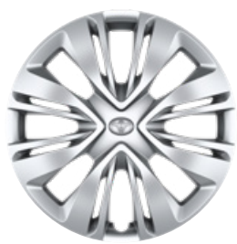
17" ocelová kola s celoplošnými kryty, pneumatiky 175/65 R17 Pro výbavu Comfort