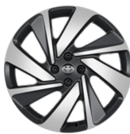
18" kola z lehké slitiny, pneumatiky 175/60 R18 Pro výbavu Executive