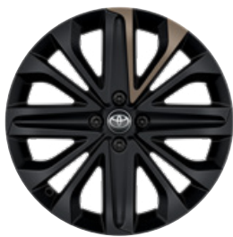
18" kola z lehké slitiny, pneumatiky 175/60 R18 Pro výbavu Style v kombinaci s Design paketem a barvou karoserie 2VJ Běžová – ginger s černou střechou.