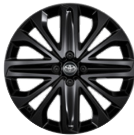
18" kola z lehké slitiny, pneumatiky 175/60 R18 Pro výbavu Style v kombinaci s Design paketem a barvou karoserie 2VN Zelená – urban s černou střechou a 2UP Modrošedá s černou střechou.