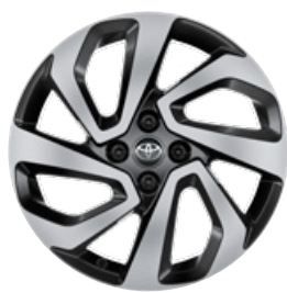
17" kola z lehké slitiny, pneumatiky 175/65 R17 Pro výbavu Style