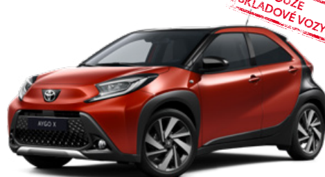
2VH Červená – chilli s černou střechou Metalický lak pro verze Style a Executive 15000 Kč