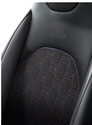
Sedadla se sportovním bočním vedením a s logem JBL a prošíváním fialová Jasmin Pro výbavu JBL Edition