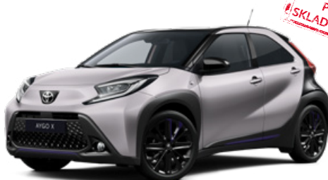
M14 Stříbrná Jasmin s černou střechou Metalický lak pro verzi JBL Edition 15000 Kč