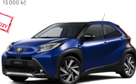
2VL Modrá – juniper s černou střechou Metalický lak pro verze Style a Executive 15000 Kč