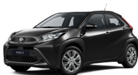
209 Černá – noční obloha Metalický lak pro verzi Comfort 10000 Kč