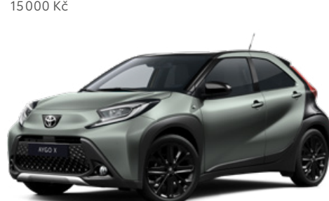
2VN Zelená – urban s černou střechou Základní a metalický lak pro verze Style a Executive 15000 Kč