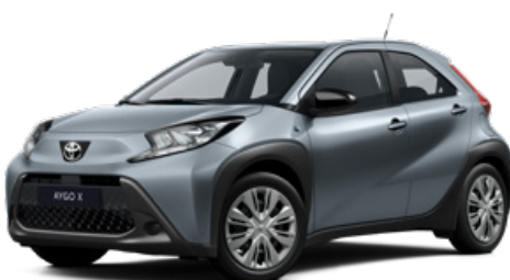
1K3 Modrošedá Metalický lak pro verzi Comfort 10000 Kč