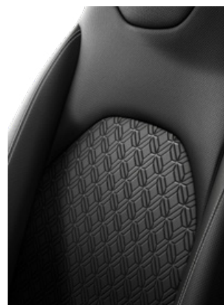
Látkové čalounění černé s bílým prošíváním pro bílé lakování karoserie Pro výbavu Style